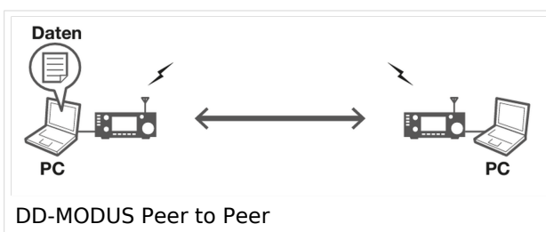
DD-MODUS Peer to Peer

Voraussetzung für den DD-Modus ist das 23-cm-Band, da wir eine TX/RX-Bandbreite von ~ 300 kHz für diese spezielle Übertragung benötigen. Da das 23cm-Band, ausgehend von der Betrachtung der Ausbreitungsbedingungen, mit geringem Antennenaufwand, eine sehr gute Reichweite bietet, ist dieses Band auch bestens geeignet Datenübertragungen zu benutzen.